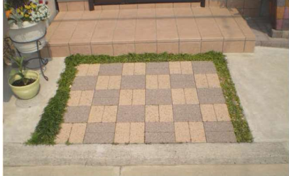
■インターロッキング&リュウのヒゲ