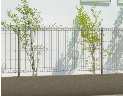
■ユメッシュフェンスE型