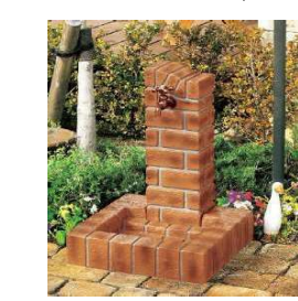
■ブリックポール 散水ボックスから変更の場合 ¥128,000~