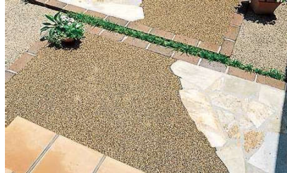
■樹脂洗い出し仕上げ