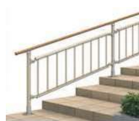
■エトランポ たて格子パネル H800用1スパン(1200) ¥18,000~ *先付の場合(手摺別途)