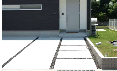
■土間スリットW100+カラー砕石